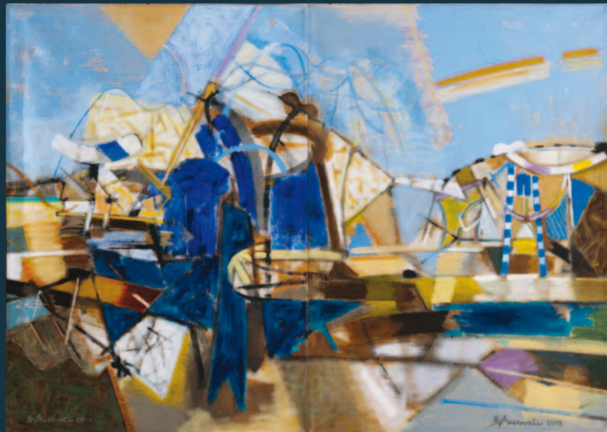
PORT BLANCHETTE, 2003; Öl auf Leinwand (Diptychon) / ulje na platnu (diptih) / olio su tela (dittico) NEUE BANDEIRANTES / NOVA BANDEIRANTES / LA NUOVA BANDEIRANTES, 2010; Acrylik auf Karton / akrilik na kartonu / acrilico su cartone

E' stato più volte premiato ed elogiato per il suo lavoro artistico. Nel 2006 è stata pubblicata la sua monografia e gli è stata attribuita un'onorificenza speciale della Città di Rovigno. Vive e lavora a Parigi e a Rovigno.